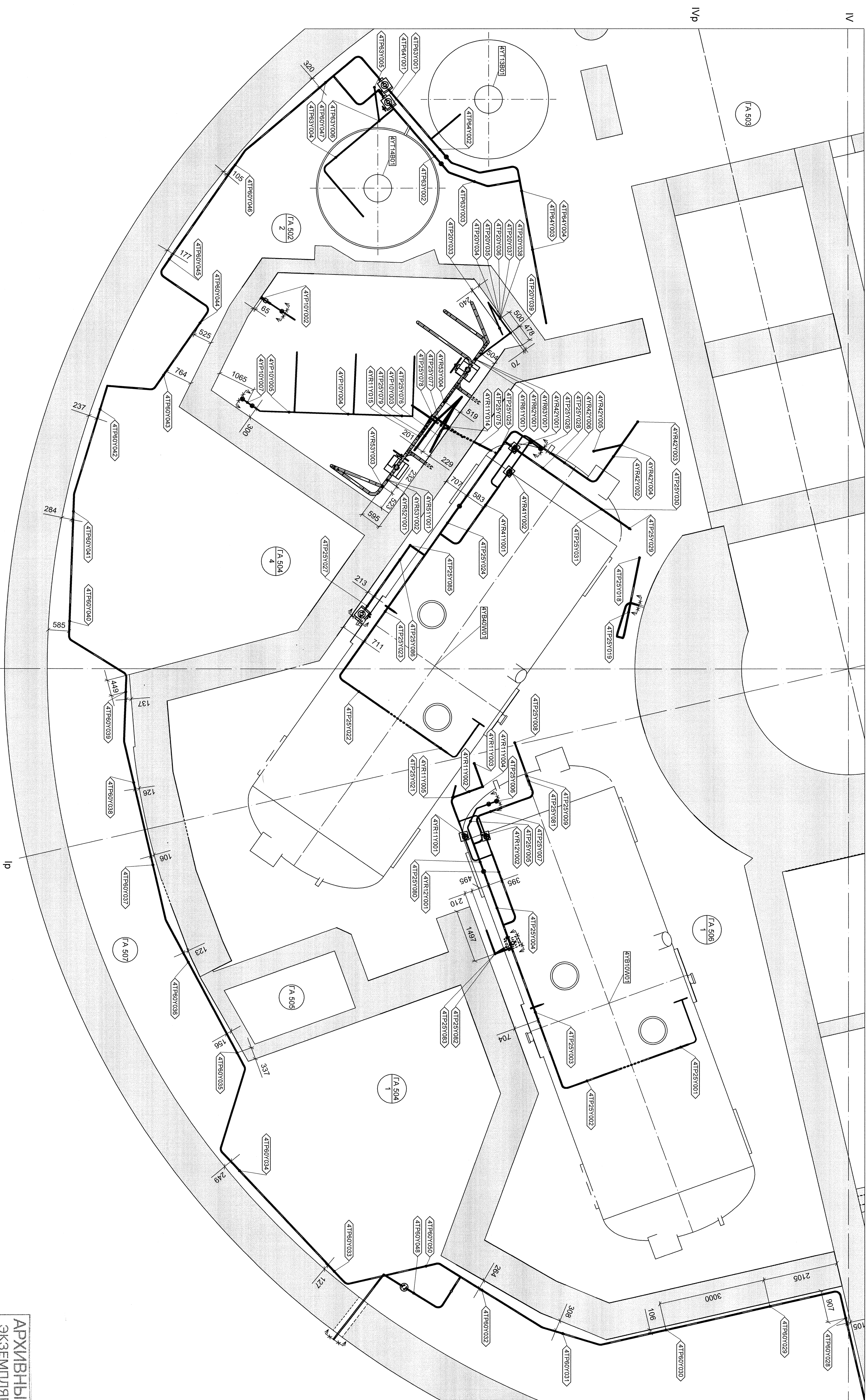
ПЛАН РАСПОЛОЖЕНИЯ ОТОП НА ОТМ.+25,700 В ОСЯХ II-I-IV (1:50)